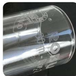
Welding and scribing of glass