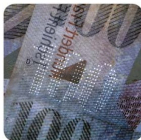
Micro-perforation of banknotes