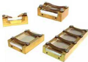
1、10、20和40mm装配在夹具上的MgO:PPLN

PPLN示意图。聚焦在PPLN上的激光转换为另一个波长。可通过合适的极化周期、晶体温度和z轴极化来实现。