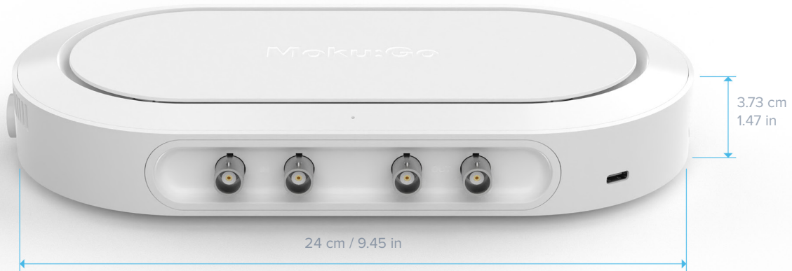
前瞻设计规格，最终产品规格可能有差异

Moku:Go为新理工科人才培养提供完善的工程实验教学解决方案，满足从强化基础教学到自主创新人才培养的课程体系。Moku:Go集成8个仪器功能并提供选配可编程电源，取代笨重、繁琐的传统台式测量设备。学生可以将全套实验室装入书包，无论身在何处随时随地都可以学习。Moku:Go可以通过自带Wi-Fi热点连接操控，集成了可靠，具有电气保护的信号接口，USB-C用作电源接口以及高速数据传输，以及6种可选颜色。Windows和Mac端的操作软件提供易用且直观的图形用户界面，还可以通过API与课程集成。Moku:Go硬件以软件设计充分考虑了用户需求，确保学生获得完整、连贯的四年学习及课外实践体验。