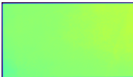
▲ 伪彩色图观察均匀性