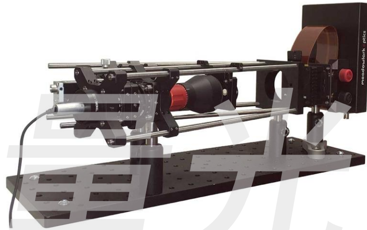
图 1. 空间光调制器系统示意图

空间光调制器光学系统包括:半波片,偏振片,透镜组,以及其他必要的安装硬件。客户也可以选择激光光源及相机。