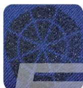
Textile, 25 pulse per pore mean power 1 W, 800 Hz