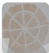
Textile, 25 pulse per pore mean power 1 W, 800 Hz