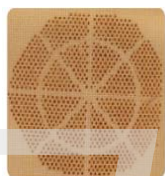
Textile, 10 pulse per pore mean power 1 W, 800 Hz

● 工业应用： 该系列激光器可用于材料加工(钻孔、切割、焊接、熔化、蒸发等)，可加工的材料包括液体、纺织品、纸张、玻璃、塑料、木材、泡沫等。此外，该系列激光器在分析仪器、激光雷达、测距、全息、自由空间通信、热源仿真等方面都有广泛应用。