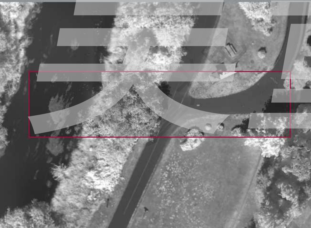
RedEdge-P在160万像素的多光谱成像系统上集成了一个510万像素的全色波段（嵌入），以实现经过像素对齐。全色图像锐化后的RGB和多光谱输出的精度能达到60m地面分辨率2cm。