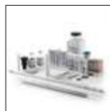
A00000193 开机启动测试套装