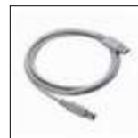
40001693 USB电脑连接 线, 5m