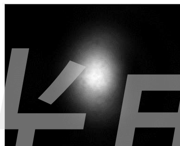
Infrared image of TEM00 laser output